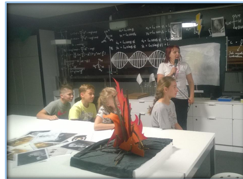
Warsztaty na temat żarówki.